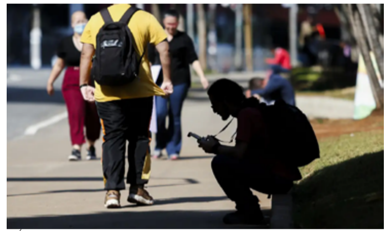
É o menor valor absoluto da série histórica aberta pelo IBGE em 2012

“Os jovens, grupo de pessoas de 15 a 29 anos de idade, de acordo com o Estatuto da Juventude, enfrentam maior dificuldade de ingresso e estabilidade no mercado de trabalho, tendo em vista sua inerente inexperiência laboral, representando o grupo mais vulnerável aos períodos de crise