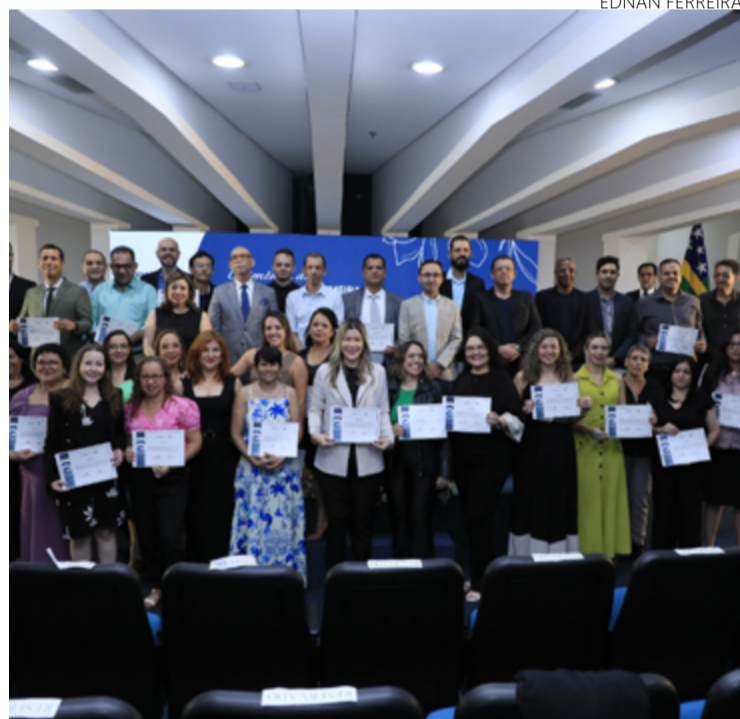
Cerimônia de encerramento da primeira turma da Escola de Governo de Goiás

A diretora anunciou a abertura da segunda turma da especialização e do mestrado, que devem ser divulgadas em breve, e destacar o crescimento da Escola nos últimos anos.