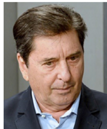
Maguito Vilela: trajetória vitoriosa em Goiás

Em 2020, Maguito Vilela ganhou as eleições para prefeito de Goiânia . Na época, ele estava internado em tratamento contra a covid-19 e tomou posse virtualmente. Maguito Vilela morreu em 13 de janeiro de 2021, aos 72 anos, em decorrência de uma infecção pulmonar.