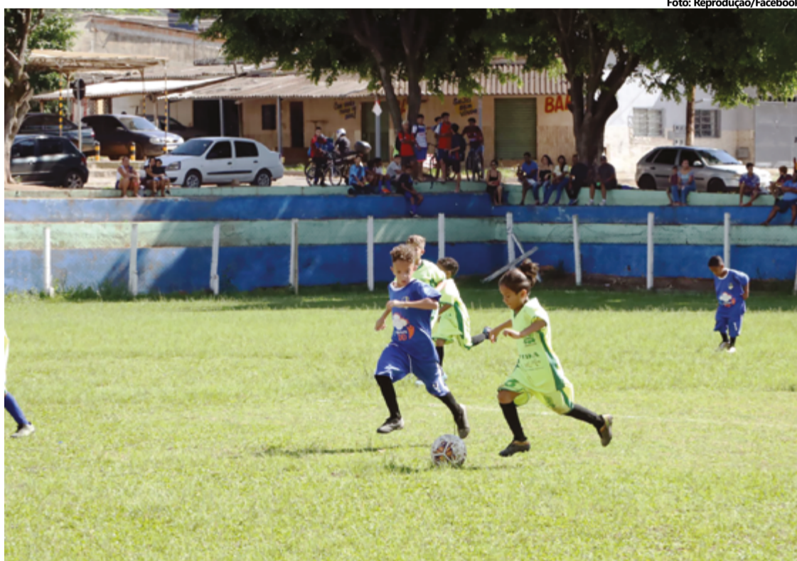
As ações de acordo com a prefeitura, são para promover qualidade de vida para a população por meio do esporte

A realização desse evento esportivo busca incentivar a participação dos jovens na prática esportiva, proporcionando oportunidades para o desenvolvimento físico e social. A presença do observador técnico do Flamengo acrescenta uma dimensão extra, oferecendo potencialmente novas perspectivas para crianças e adolescentes locais interessados no futebol.