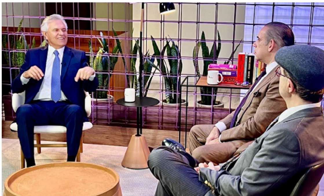
Ronaldo Caiado com os jornalistas Reinaldo Azevedo e Walfrido Warde: debate sobre o futuro do Brasil

O União Brasil é hoje a terceira maior bancada na Câmara dos Deputados, com 61 parlamentares, e segunda maior do Senado, com 14 senadores. O partido tem ainda três governadores. Caiado é visto por seus correligionários, principalmente os remanescentes do antigo DEM, como o nome com potencial político/administrativo suficiente para se apresentar como candidato a presidente nas próximas eleições. Caiado avalia que, na condição de um grande partido político, com tempo de televisão, recursos suficientes e grandes quadros, o União Brasil tem que estar preparado para lan-