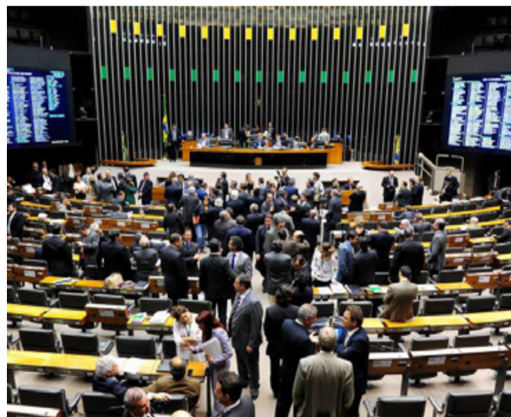
Congresso pressiona o Palácio do Planalto para garantir recursos de R$ 4,9 bi para o fundão eleitoral

Diante do impasse, a votação dos projetos que definem o Orçamento de 2024 tem atrasado. O deputado Danilo Forte (União Brasil-CE), relator da LDO (Lei de Diretrizes Orçamentárias), que dá bases para o Orçamento, disse a aliados que não deverá se envolver na disputa do fundo eleitoral. E que apresentará a nova versão do projeto nesta quinta-feira (7). O texto, porém, só deverá ser votado na próxima semana.