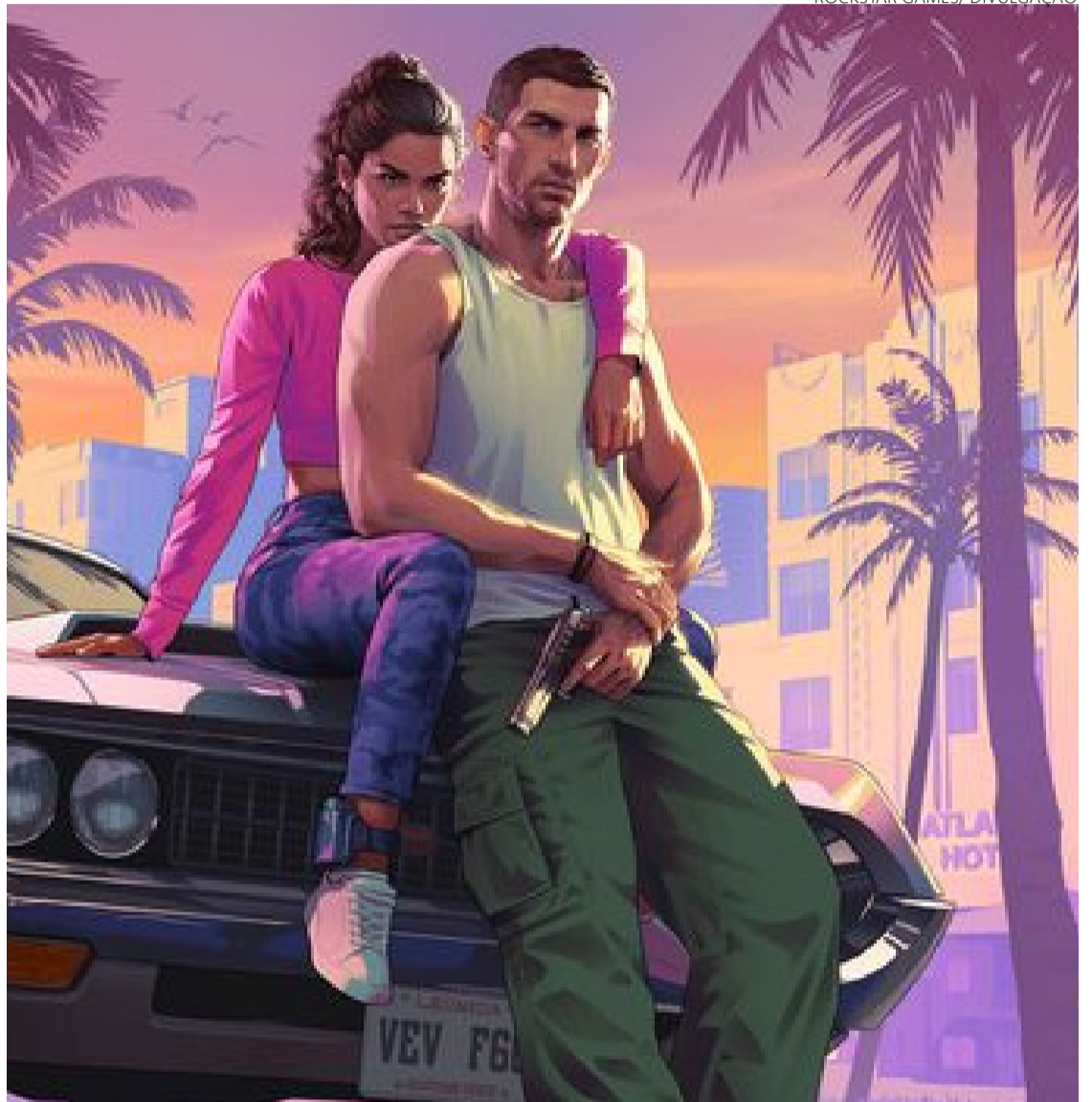
Pós-modernidade, à esquerda: jogo debocha de conectividade ao retratar redes sociais. Em cima, protagonistas da trama